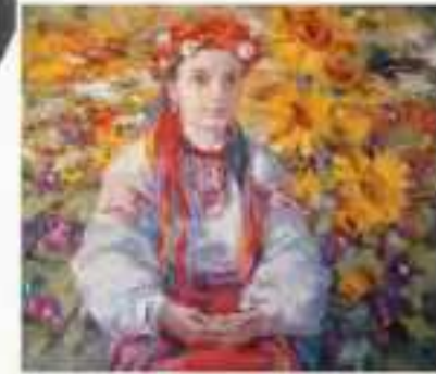
«Коханка» (художник: Дмитро Яворський, 2010 р.)