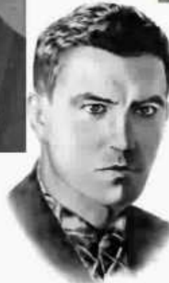
Василь Стус (1938—1985)