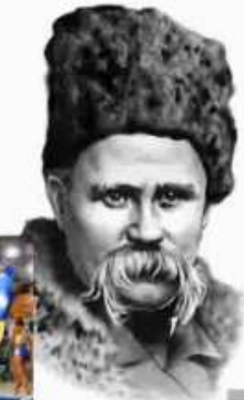
Тарас Шевченко (1814—1861)