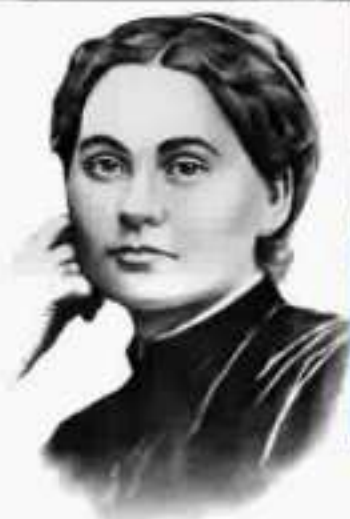
Марко Вовчок (1833—1907)