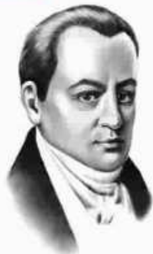
Іван Котляревський (1769—1818)