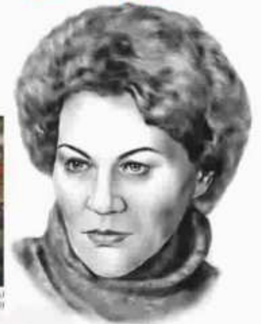
Ліна Костенко (кар. 1930 р.)